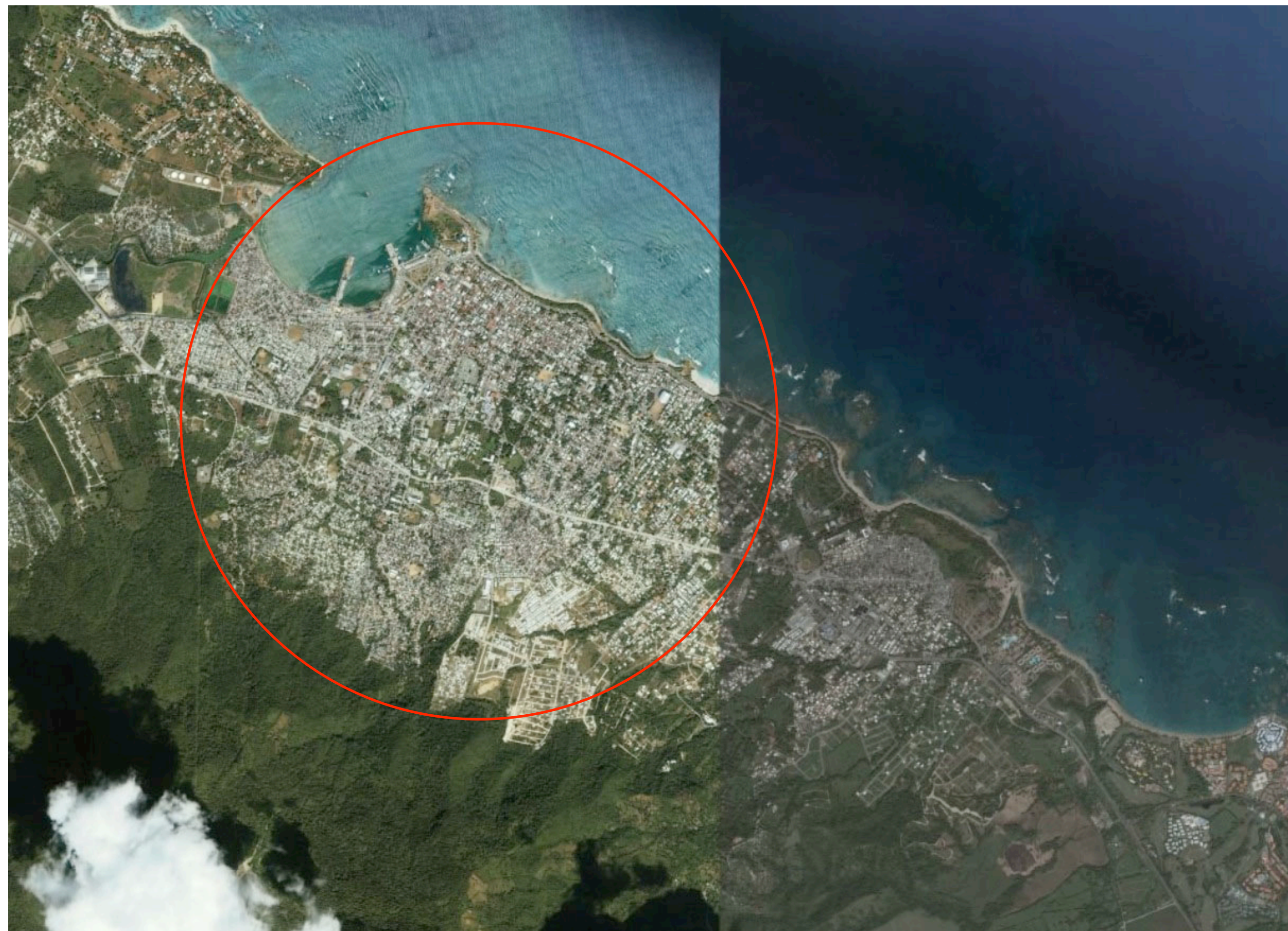
A-1 UBICACION 01 ESC 1: 200,000